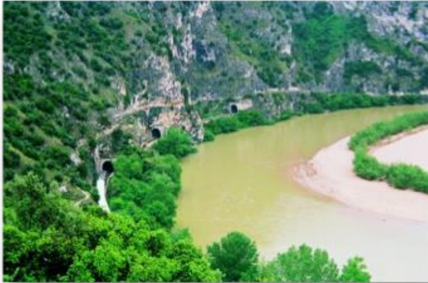
Εικόνα 2. Δήμος Νέστου

Ειδικότερα ο Δήμος Νέστου στοχεύει στην: