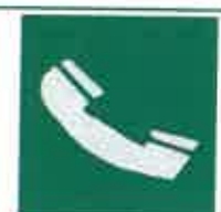
Τηλέφωνο για διάσωση και πρώτες βοήθειες

Όταν πρέπει να δείξουμε την κατεύθυνση που πρέπει να ακολουθήσουμε για να φτάσουμε στα μέσα βοήθειας ή διάσωσης τότε τα αντίστοιχα σήματα συνδυάζονται ανάλογα με τα παρακάτω σήματα κατεύθυνσης