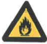
Εύφλεκτες ύλες ή/ και υψηλή θερμοκρασία