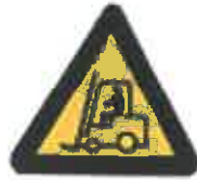
Οχήματα διακίνησης φορτίων