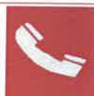
Τηλέφωνο για την καταπολέμηση πυρκαγιών

Όταν πρέπει να δείξουμε την κατεύθυνση που πρέπει να ακολουθήσουμε για να φτάσουμε στον πυροσβεστικό εξοπλισμό τότε τα αντίστοιχα σήματα συνδυάζονται ανάλογα με τα παρακάτω σήματα κατεύθυνσης