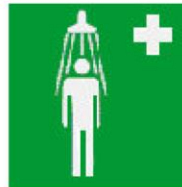
Θάλαμος καταιονισμού ασφαλείας