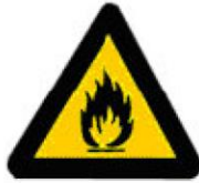
Εύφλεκτες ύλες ή/ και υψηλή θερμοκρασία