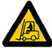
Οχήματα διακίνησης φορτίων