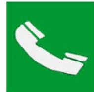
Τηλέφωνο για διάσωση και πρώτες βοήθειες

Όταν πρέπει να δείξουμε την κατεύθυνση που πρέπει να ακολουθήσουμε για να φτάσουμε στα μέσα βοήθειας ή διάσωσης τότε τα αντίστοιχα σήματα συνδυάζονται ανάλογα με τα παρακάτω σήματα κατεύθυνσης