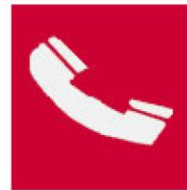
Τηλέφωνο για την καταπολέμηση πυρκαγιών

Όταν πρέπει να δείξουμε την κατεύθυνση που πρέπει να ακολουθήσουμε για να φτάσουμε στον πυροσβεστικό εξοπλισμό τότε τα αντίστοιχα σήματα συνδυάζονται ανάλογα με τα παρακάτω σήματα κατεύθυνσης