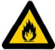
Εύφλεκτες ύλες ή/ και υψηλή θερμοκρασία