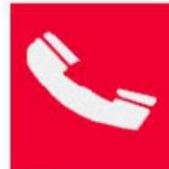
Τηλέφωνο για την καταπολέμηση πυρκαγιών

Όταν πρέπει να δείξουμε την κατεύθυνση που πρέπει να ακολουθήσουμε για να φτάσουμε στον πυροσβεστικό εξοπλισμό τότε τα αντίστοιχα σήματα συνδυάζονται ανάλογα με τα παρακάτω σήματα κατεύθυνσης