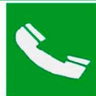
Τηλέφωνο για διάσωση και πρώτες βοήθειες

Όταν πρέπει να δείξουμε την κατεύθυνση που πρέπει να ακολουθήσουμε για να φτάσουμε στα μέσα βοήθειας ή διάσωσης τότε τα αντίστοιχα σήματα συνδυάζονται ανάλογα με τα παρακάτω σήματα κατεύθυνσης