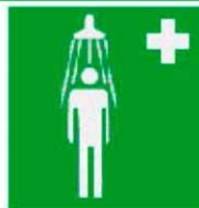
Θάλαμος καταιονισμού ασφαλείας