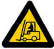
Οχήματα διακίνησης φορτίων