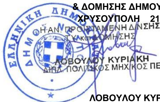
ΛΟΒΟΥΛΟΥ ΚΥΡΙΑΚΗ ΔΙΠΛ. ΠΟΛΙΤΙΚΟΣ ΜΗΧΑΝΙΚΟΣ Π.Ε.

& ΔΟΜΗΣΗΣ ΔΗΜΟΥ ΝΕΣΤΟΥ ΧΡΥΣΟΥΠΟΛΗ 21-03-2023