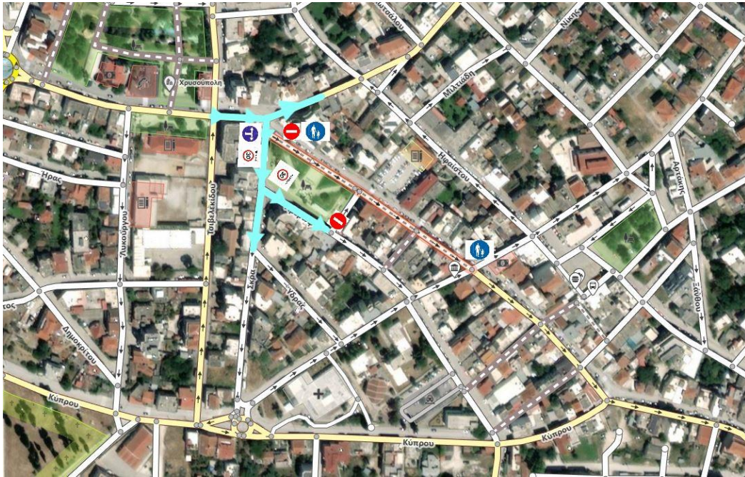
Εικόνα 1. Σημεία παρέμβασης

Βεβαιώνεται ότι με τις παραπάνω επεμβάσεις η κυκλοφοριακή ρύθμιση: