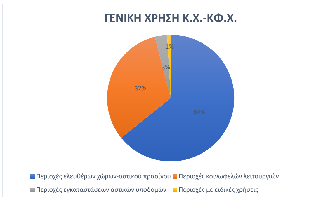
Διάγραμμα 1. Γενική χρήση κοινοχρήστων και κοινωφελών χώρων

Όσον αφορά τη γενική χρήση των χώρων αυτών, πρόκειται για περιοχές ελευθέρων χώρων –αστικού πράσινου, περιοχές κοινωφελών λειτουργιών, περιοχές για εγκαταστάσεις αστικών υποδομών κοινής ωφέλειας και περιοχές με μικτές ειδικές χρήσεις, ενώ τρόπος με τον οποίο κατανέμονται στις κατηγορίες αυτές απεικονίζονται στο Διάγραμμα 1.